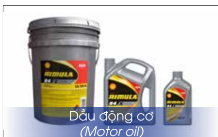
Dầu động cơ (Motor oil)

Especially Phương Ngọc is a supplier Industrial quality petroleum jelly of Royal Dutch Shell Group in Vietnam, with a diversified product portfolio, including: