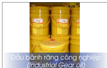
Dầu bánh răng công nghiệp (Industrial Gear oil)