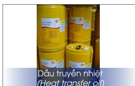
Dầu truyền nhiệt (Heat transfer oil)