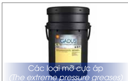
Các loại mỡ cực áp (The extreme pressure greases)