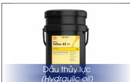
Dầu thủy lực (Hydraulic oil)