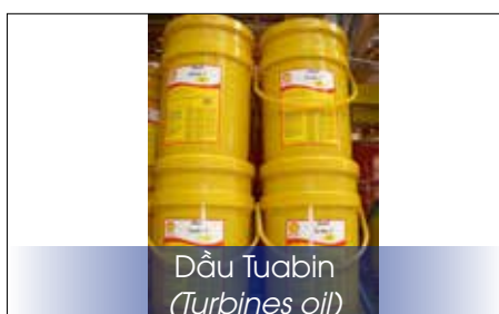
Dầu Tuabin (Turbines oil)