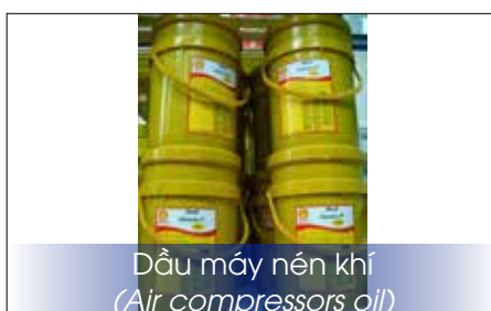
Dầu máy nén khí (Air compressors oil)