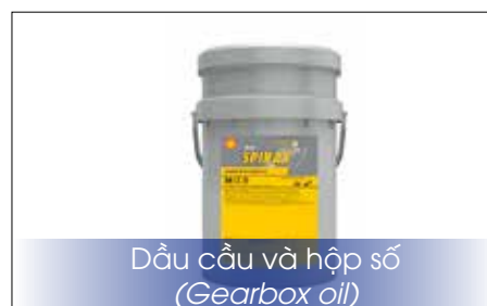
Dầu cầu và hộp số (Gearbox oil)