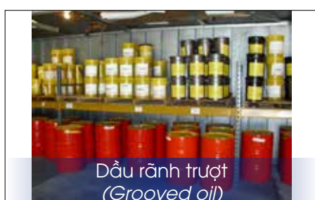
Dầu rãnh trượt (Grooved oil)