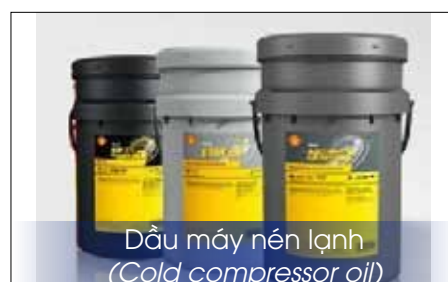
Dầu máy nén lạnh (Cold compressor oil)